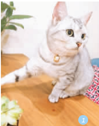
1号宠物:七七七 宠物主人:@蠢猫猫

添加微信号 zyu107a 进入贵阳晚报宠物群,撸狗吸猫、结识宠友,分享养宠的酸甜苦辣!