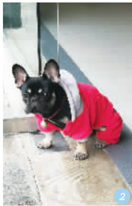
2号宠物:葡萄 宠物主人:@英子

宠物介绍:美短妹妹七七七,一岁零两个月。它喜欢睡觉、好吃零食,性格温顺、黏人,出门在外毫不畏惧,永远是街上和咖啡厅里最靓的猫仔!