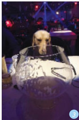
3号宠物:钱多多 宠物主人:@porno monk

宠物介绍:我叫钱多多,号称“夜场小王子”。其实我不喜欢喝酒,但由于颜值太高,常有美女请我喝一杯。如果你也喜欢我,买好酒,等我。