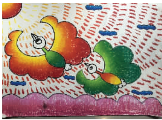
杨月梓涵 南明小学 六(3)班