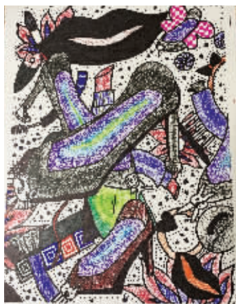
李添然 11岁 贵阳市市东小学