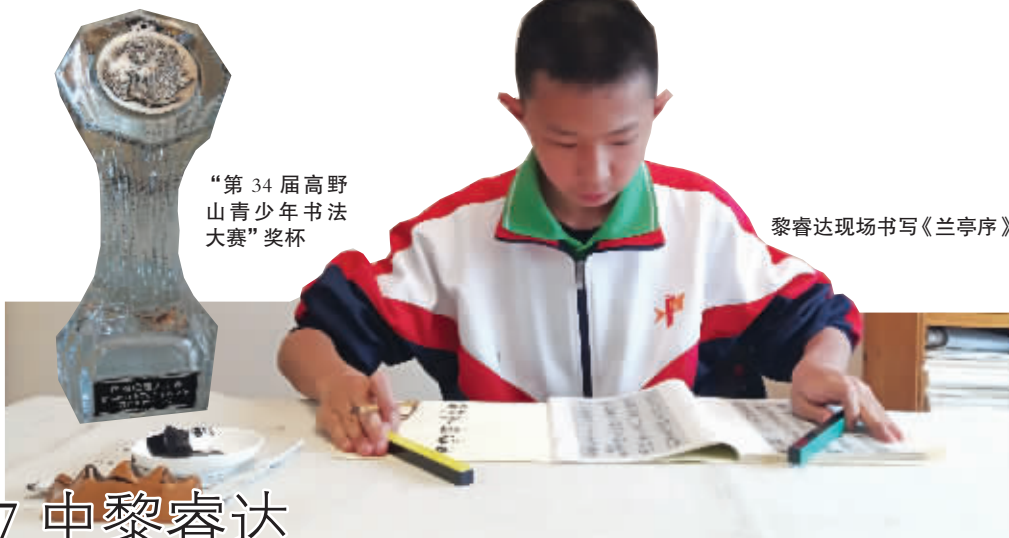
“第34届高野山青少年书法大赛”奖杯