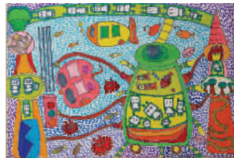
雷袁楚寒 南明小学 六(8)班