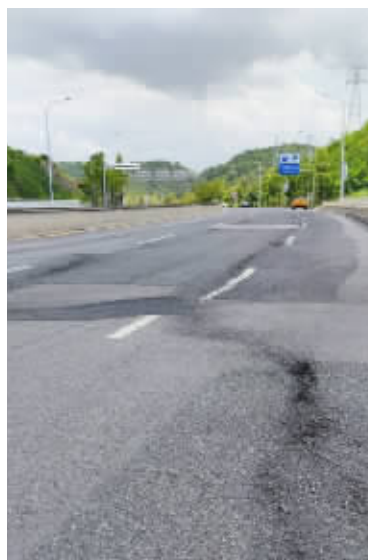
道路破损较为严重