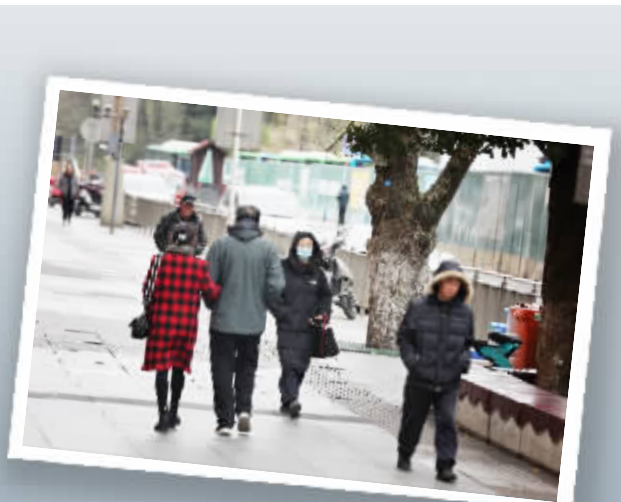
街头,市民都穿上了厚厚的冬装。