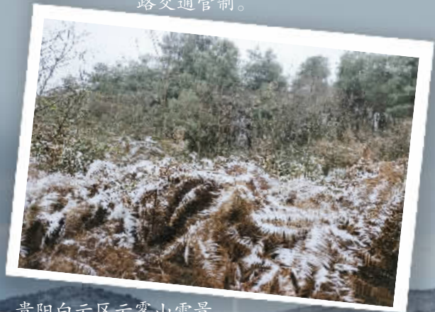
贵阳白云区云雾山雪景