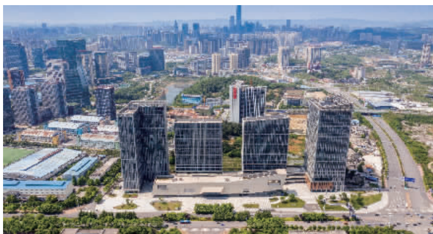
图为：阳光城·启航中心项目

该项目定位为贵阳融媒文化创意产业园，以文化为核心，以科技为重点，以旅游、金融、旅游、网络金融等产业，积极推进“文化、科