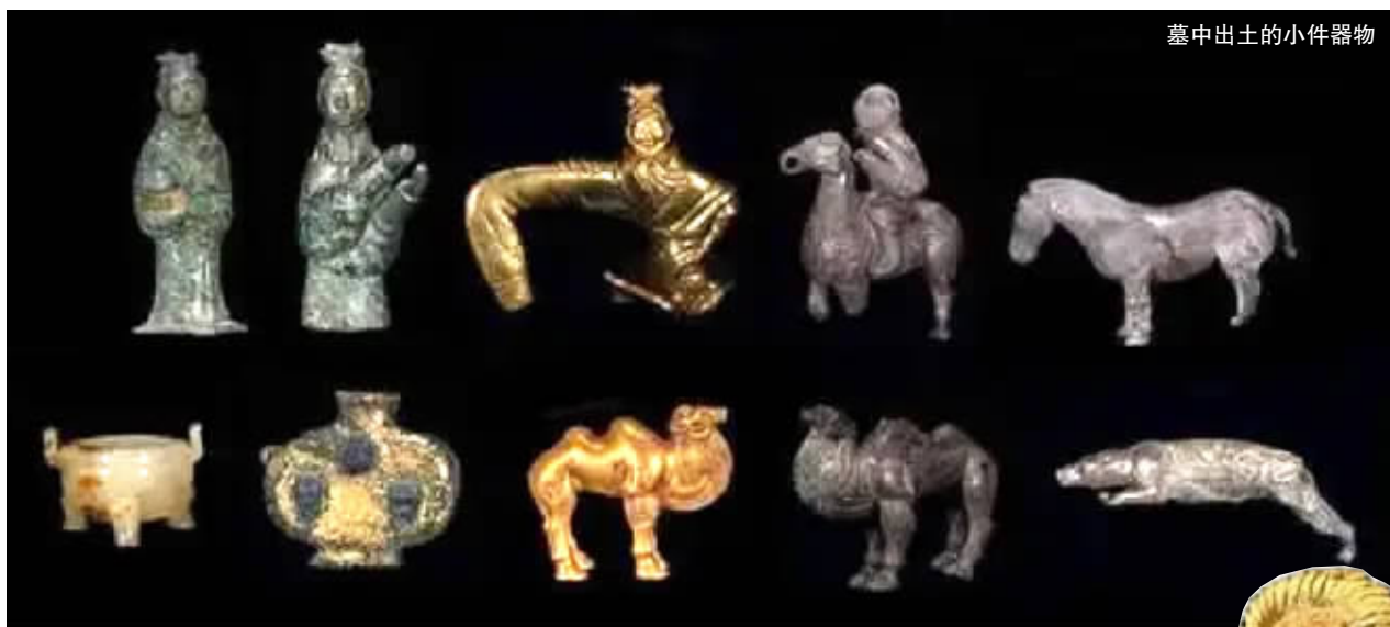
墓中出土的小件器物