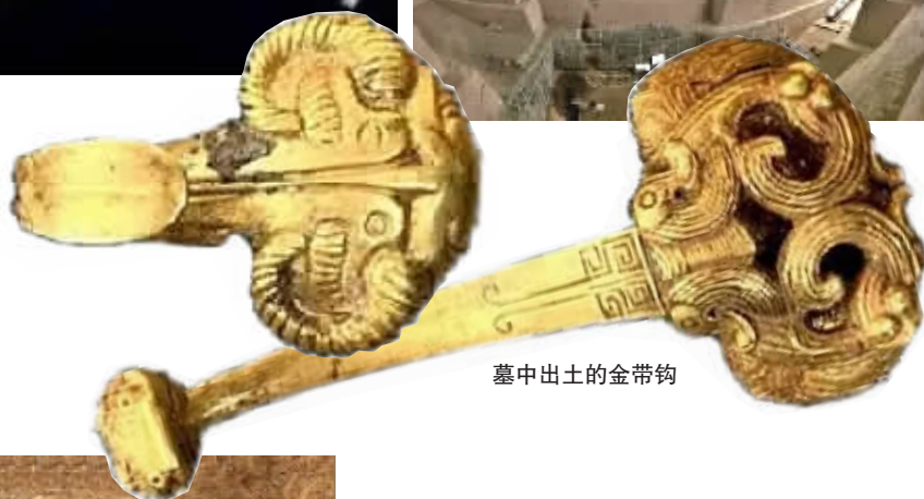
墓中出土的金带钩

1月26日，秦始皇帝陵博物院公布了秦始皇帝陵1号陪葬墓的最新考古成果。经考古发现，1号陪葬墓因墓主等级极高，可以确定是帝陵规制下的“秦帝国第一陪葬墓”。