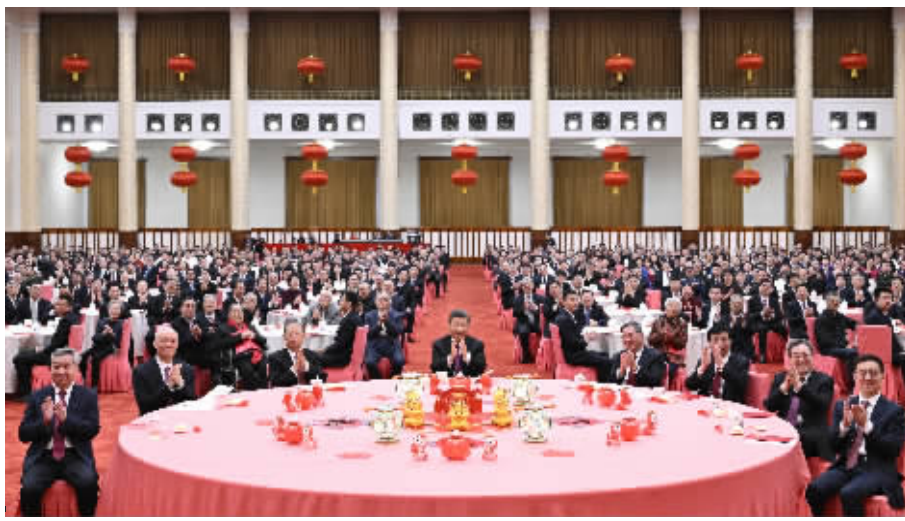
2月8日，中共中央、国务院在北京人民大会堂举行2024年春节团拜会。党和国家领导人习近平、李强、赵乐际、王沪宁、蔡奇、丁薛祥、李希、韩正等同首都各界人士齐聚一堂，共迎新春。新华社发

新华社北京2月8日电 中共中央、国务院8日上午在人民大会堂举行2024年春节团拜会。中共中央总书记、国家主席、中央军委主席习近平发表讲话，代表党中央和国务院，向全国各族人民，向香港特别行政区同胞、澳门特别行政区同胞、台湾同胞和海外侨胞拜年。