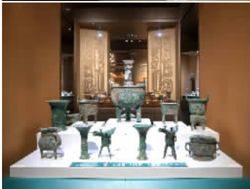
以上 5 张图为博物馆新馆展厅内的陈列布置