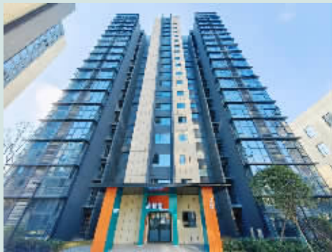
多彩澜庭人才租房项目外景