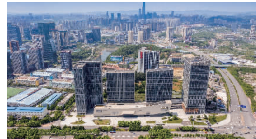
图为：阳光城·启航中心项目

该项目定位为贵阳融媒文化创意产业园，以文化为核心，以科技为重点，以旅游、金融为驱动，大力发展大数据、文化创意、移动互联网、旅游、网络金融等产业，积极推进“文化、科