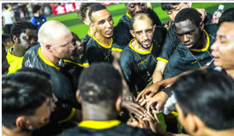
贵州大学国际学生足球队球员互相加油鼓劲