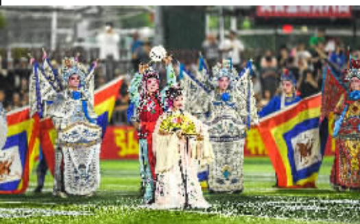
上饶渣渣灰江西米粉足球队的助威团在中场休息时进行表演