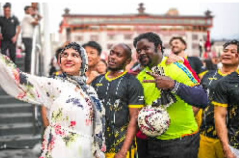
一名女留学生和贵州大学国际学生足球队球员自拍合影