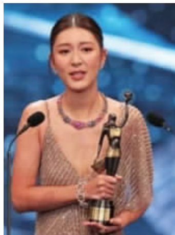
余香凝获得最佳女主角奖