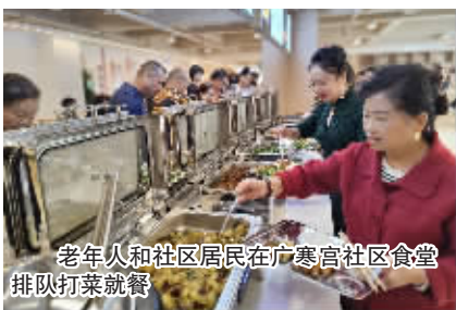
老年人和社区居民在广寒宫社区食堂排队打菜就餐

本报讯 4月28日是贵阳工商康养产业投资发展有限公司宝山苑周年庆，该公司广寒宫社区食堂在宝山苑正式投运。据了解，这是目前贵阳贵安养老机构中规模最大的社区食堂和老年餐桌。