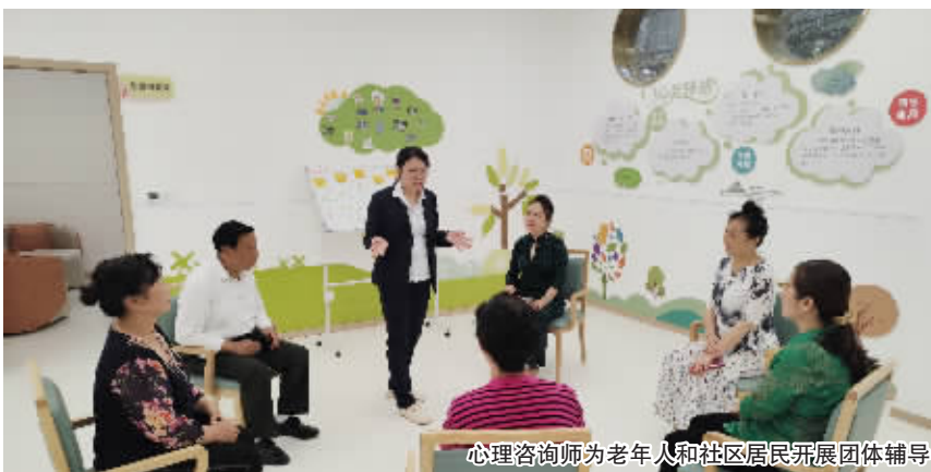
心理咨询师为老年人和社区居民开展团体辅导