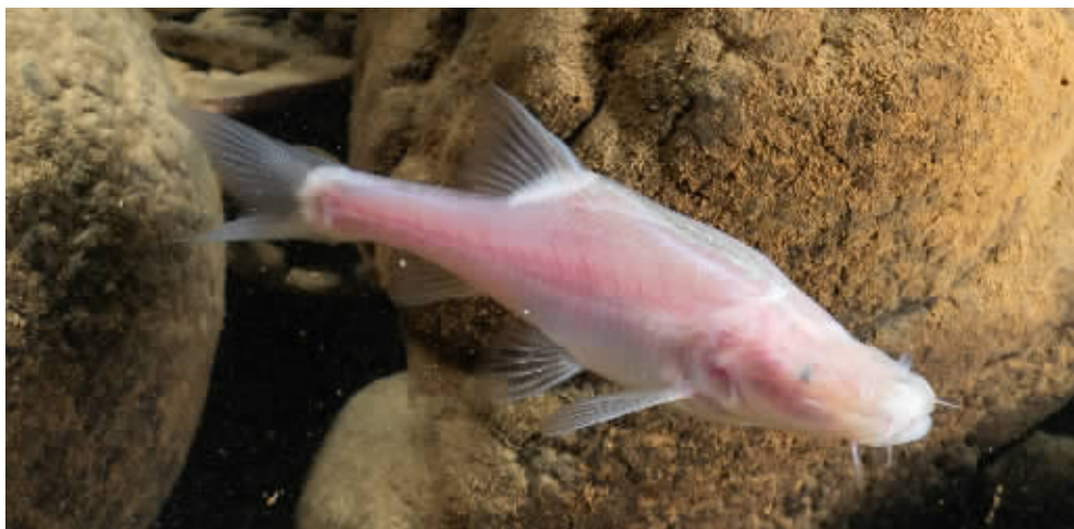
科研人员在长江上游乌江流域一溶洞地下河拍摄的“贵阳金线鲃”