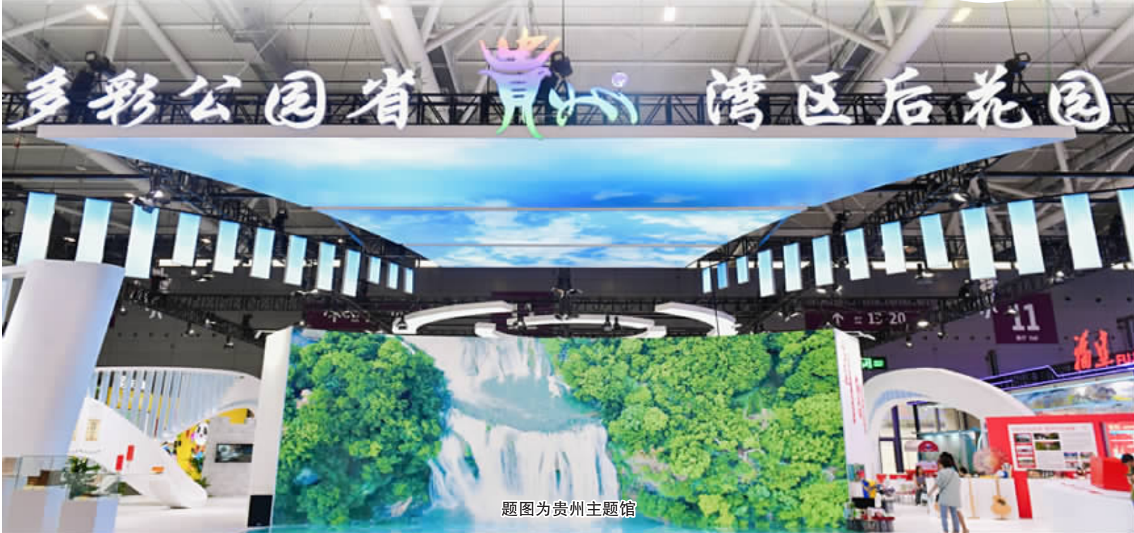
题图为贵州主题馆