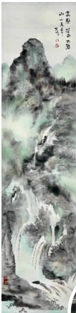
四图均为胡世鹏的绘画作品