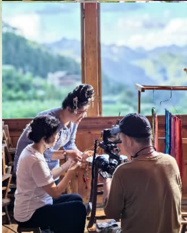
此行,摄制组前往黔东南雷山猫猫河、阳荷、乌东苗寨,榕江乌吉等苗寨进行拍摄,还去了凯里开发区创意产业园。本版图片均为拍摄花絮。