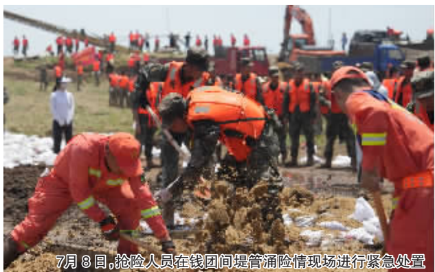
7月8日,抢险人员在钱团堤管涌险情现场进行紧急处置

好物料配合,以每小时四船、2000立方米的进度,加大水上抛投力度,压实水下基础,通过平堵和立堵结合,按照每天60至80米的速度推进,确保决口在9日12时前合龙。同时,有关部门提前科学选择排涝泵站设置点,依照团洲垸排涝方案,随时做好排涝准备。