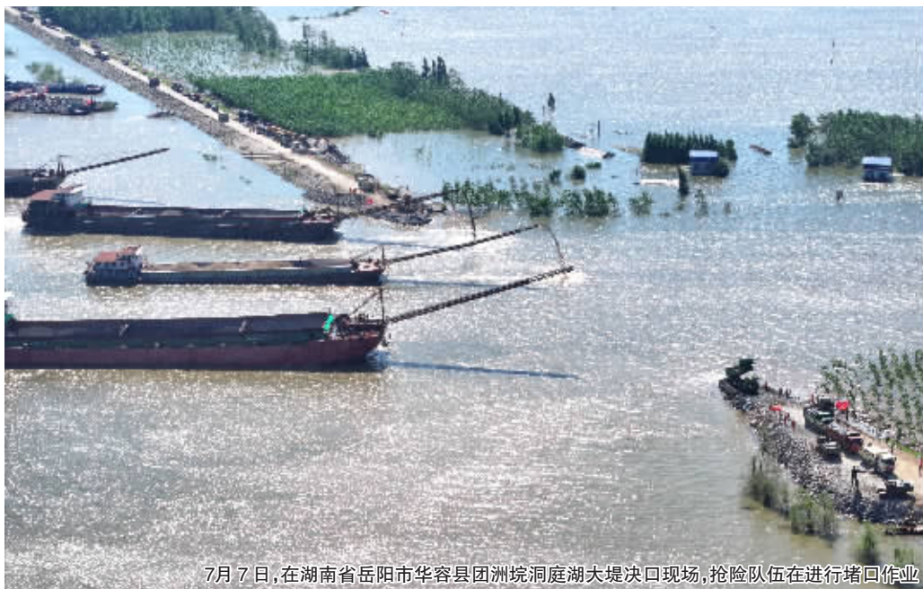
7月7日,在湖南省岳阳市华容县团洲垸洞庭湖大堤决口现场,抢险队伍在进行堵口作业