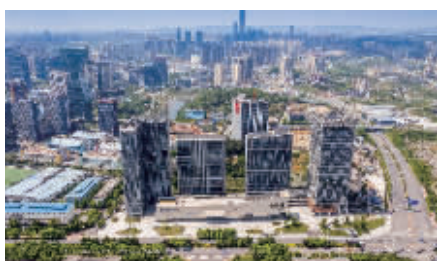
图为阳光城·启航中心项目

阳光城·启航中心项目位于贵阳市高新区黔灵山路与同城大道交会处,地理位置得天独厚,交通条件便捷。目前入住情况