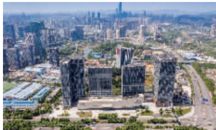
图为阳光城·启航中心项目

阳光城·启航中心项目位于贵阳市高新区黔灵山路与同城大道交会处,地理位置得天独厚,交通条件便捷。目前入住情况