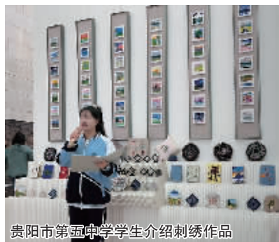
贵阳市第五中学学生介绍刺绣作品

课堂的授课方式面向社会传授版画、油画、国画等多种艺术门类的知识，至今已举办系列课堂24场，惠及线上线下观众七万余人，深受学员、市民的好评。此次活动以