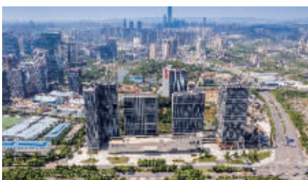
图为阳光城·启航中心项目

阳光城·启航中心项目位于贵阳市高新区黔灵山路与同城大道交会处，地理位置得天独厚，交通条件便捷。目前入住情况