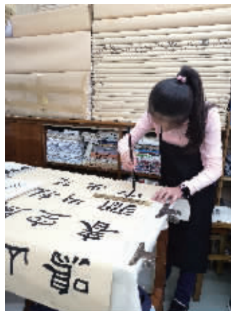
全国中小學生 美術書法一等獎的作品