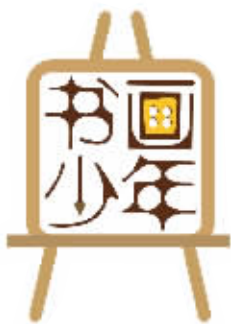
第二十四期 制图 / 管配

书法和绘画讲究美、探究美，都创造美的意境，书法被誉为：无言的诗、无图的画、无声的乐。