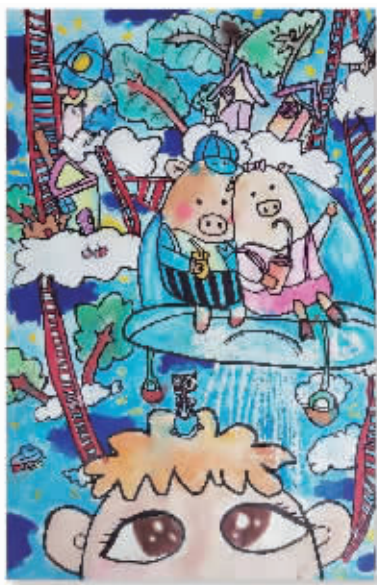
邓诗梦 贵阳实验二幼石城分校 大一(1)班