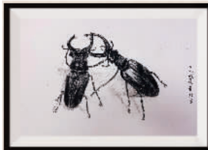
段毅 贵阳第二十八中学 七年级(1)班