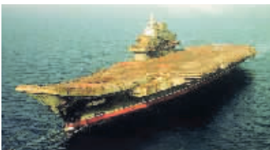
辽宁舰前身瓦良格号