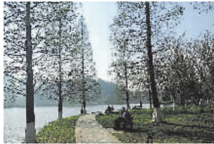
宋伟 作品《满园春色关不住》