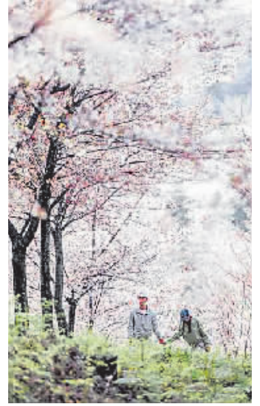
李雁秋 作品《樱之雪》

张春景美图,在贵阳晚报及所属新媒体平台进行广泛传播。活动结束后将评选出一、二、三等奖并颁发对应的奖金,其中最高奖金2000元,最低奖金500元。春色正向人间报晓,贵阳晚报期待您的来稿。