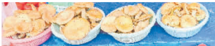
贵阳菜市场的野生菌

与延安北巷不同,在云岩区的北新区路菜场,有3个摊位在售卖野生菌,野生菌被装在筐里或小篮子里,分别是紫花菌和黄丝菌。紫花菌每公