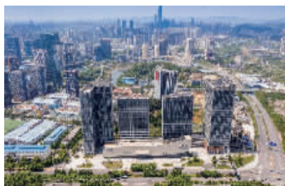
图为阳光城·启航中心项目

阳光城·启航中心项目位于贵阳市高新区黔灵山路与同城大道交会处,地理位置得天独厚,交通条件便捷。目前入住情况