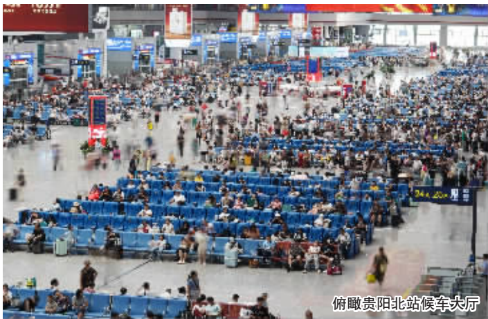
俯瞰贵阳北站候车大厅