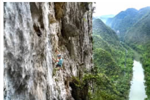
《寻找最美目的地:秘境贵州》海报及剧照