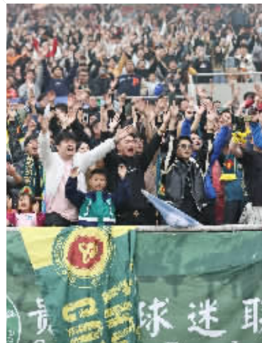
这场胜利让全场沸腾

文 / 贵阳日报融媒体记者 丁明雪 图 / 贵阳日报融媒体记者 周永 杨才江 张晨