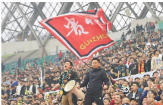
看台上的球迷为筑城竞技呐喊助威

10月13日,2024中冠联赛总决赛B组分组赛最后一轮比赛在贵阳奥林匹克体育中心举行。贵州筑城竞技主场作战,1比0战胜曲靖宜步,成功冲入中乙联赛。