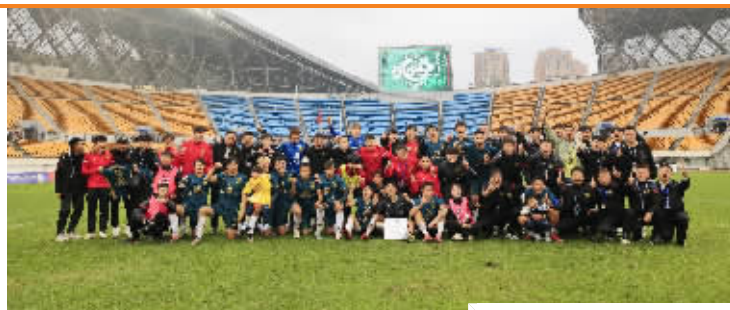
筑城竞技将士赛后合影