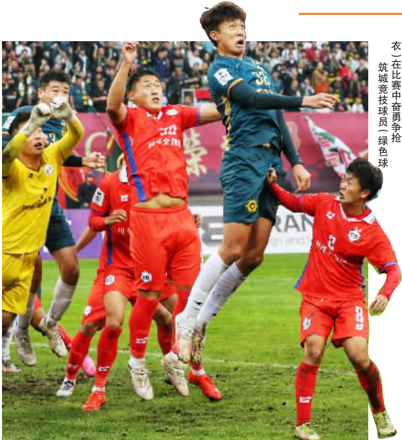
衣(在比赛中奋勇争抢筑城竞技球员(绿色球)

贵州此前曾出现过贵州人和、贵州恒丰等职业足球俱乐部,但都已退出职业足球的历史舞台。为回应球迷期待、推动足球事业发展,2022年8月,贵阳市体育发展有限公司(贵阳奥体中心)和贵州黔之星足球俱乐部有限公司签订战略合作协议,依托贵州黔之星青少年足球运动俱乐部的青训基础,为贵州组建一支职业足球队。2023年12月,贵州筑城竞技足球俱乐部正式组建。