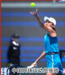
中国网球运动员张帅