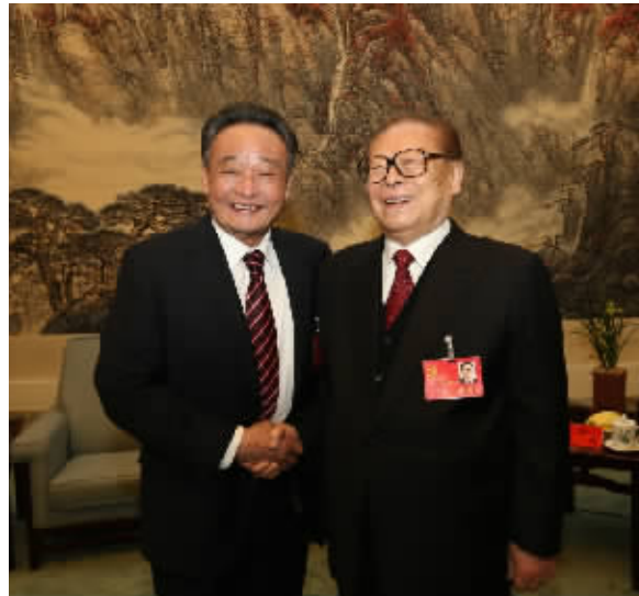
2012年11月14日，中国共产党第十八次全国代表大会在北京闭幕。这是闭幕会前，江泽民同志与吴邦国同志在一起。