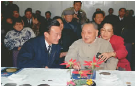
1992年2月10日，邓小平同志在上海贝岭微电子制造有限公司参观时与吴邦国同志交谈。