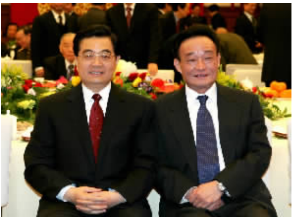
2005年1月1日，全国政协在北京举行新年茶话会。这是胡锦涛同志与吴邦国同志在一起。