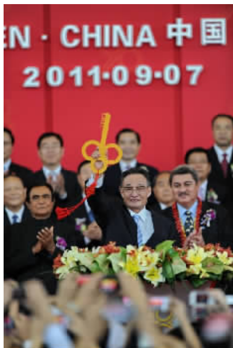
2011年9月7日,吴邦国同志在福建厦门出席第十五届中国国际投资贸易洽谈会开幕式。