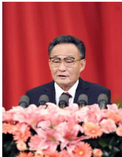
2011年3月10日,十一届全国人大四次会议在北京人民大会堂举行第二次全体会议。吴邦国同志作全国人民代表大会常务委员会工作报告。 新华社发