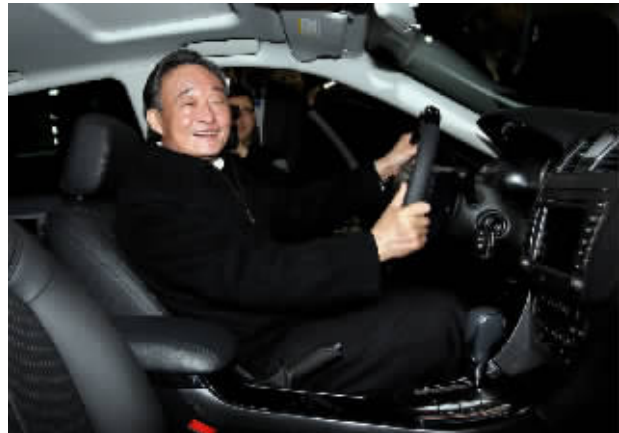
2010年1月30日,吴邦国同志在上海汽车集团股份有限公司技术中心察看新能源样车。