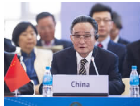
2013年1月28日,吴邦国同志在俄罗斯符拉迪沃斯托克出席亚太议会论坛第21届年会,并作题为《坚持和平发展 促进合作共赢》的主旨发言。