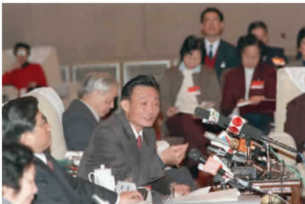
1994年3月,时任上海市委书记的吴邦国同志在全国两会上海代表团全团会议上。