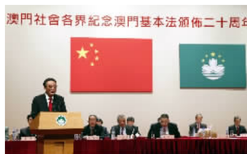
2013年2月21日,吴邦国同志在澳门文化中心出席澳门基本法颁布二十周年纪念大会并发表讲话。