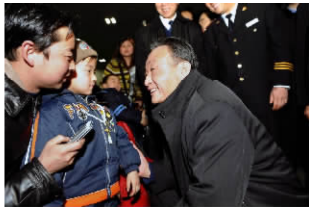
2008年2月3日,吴邦国同志在北京西站候车室与旅客交谈。