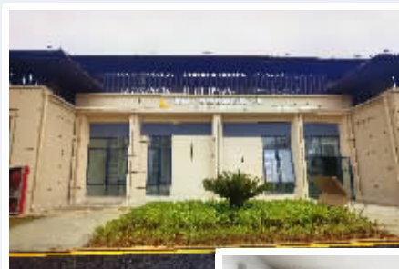
公寓提供一站式配套保障