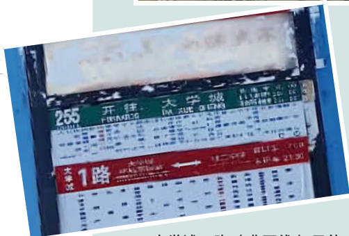
大学城1路（非环线）已停运，站牌未摘除