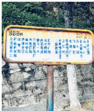
888路停运，站牌未摘除