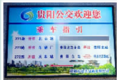
市民反映在贵阳东站开往贵阳北站的专线已经停运，站牌未更新