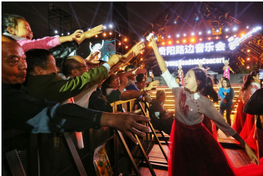
“贵阳路边音乐会”成为全省继“村BA”“村超”后的又一文旅顶流和文化盛宴。