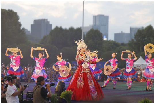
“民族团结演艺大联欢”活动点燃了独属贵州的“最炫民族风”。