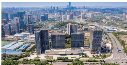
图为阳光城·启航中心项目

阳光城·启航中心项目位于贵阳市高新区黔灵山路与同城大道交会处,地理位置得天独厚,交通条件便捷。目前入住情