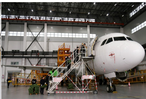
前维修厂拆解的 4 架波音 737-700 飞机相比，A320 飞机存在结构组装、系统原理、外

观设计、机身尺寸等方面差异。因此，维修厂相关项目团队在重新梳理《航空器拆解管理规定》的基础上，还进一步明确了该机型拆解涉及的安全质量管理、工程技术支持、人员资质准备、生产计划控制和设备支援保障等各系统的工作要求、流程与内容。