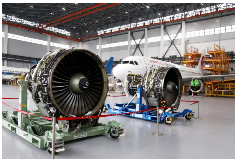
达 660 余项，计划拆解部件 1217 个，拆解周期约 30 天，所需工时 5000 小时左右。与之