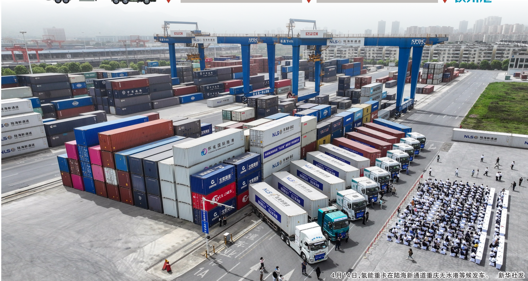
4月14日,氢能重卡在陆海新通道重庆无水港等候发车。