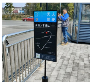
无人驾驶公交接驳服务站牌

4月24日,记者从贵阳高新区企业贵州勘设泰宇坦行科技有限公司(下称贵州勘设泰宇坦行)获悉,全省首条无人驾驶公交线路将于5月4日开通。