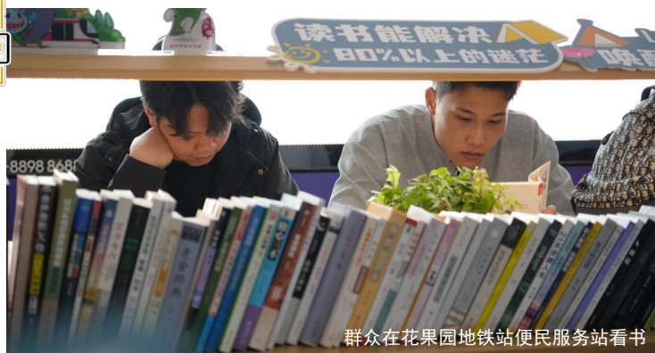
群众在花果园地铁站便民服务站看书