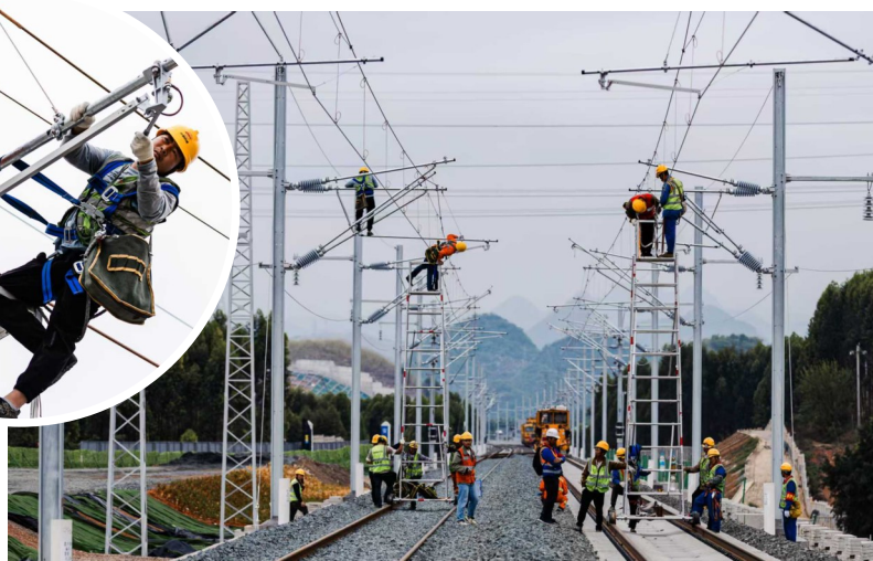
两图为验收组正在查看盘兴高铁接触网首件工程