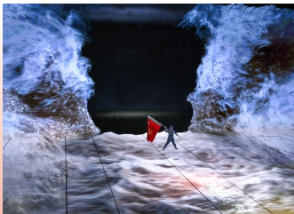
贵州长征文化数字艺术馆里的《红飘带·伟大远征》表演