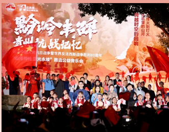
在贵阳市云岩区文昌阁日晷广场举办的主题为“黔岭丰碑 贵州抗战记忆”的路边公益音乐会