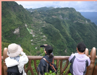
游客在贵州省晴隆县二十四道拐观景台拍照