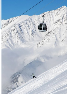
阿勒泰成为现代滑雪胜地