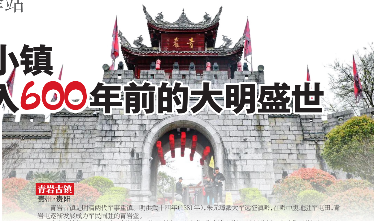
青岩古镇 贵州·贵阳

可以说，贵州是一个大屯堡。在明王朝鼎盛时期，卫所、屯堡曾遍布贵州省的每一个角落。而当历史的风云散去，这些军事设施完成了自己的历史使命，渐渐消融在高原的山水里，成为了今天装满屯堡故事的古城，而黔中屯堡人，更以其遗存的古风 and 鲜明的特色为世人所惊叹、震撼。