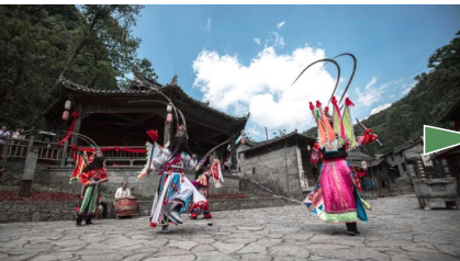
天龙屯堡 贵州·安顺

在青岩古镇，可以感受深厚历史，也可以品尝各类美食。遍布古镇的各类碑文、古建筑、文物都在诉说古镇的历史变迁和文化沉淀，状元猪蹄、米豆腐、糕耙稀饭等美食也深受游客喜爱。