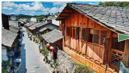
旧州古镇 贵州·安顺

为纪念随明军入黔的四位始祖而修建的“四公碑”、拥有六百多年历史的古屋“九道坎”、还有将民居开辟为地戏表演场地的“演武堂”，无不诉说着它的风采。