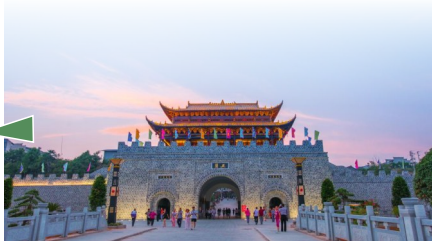
隆里古城 贵州·黔东南

古城的街区与建筑群多形成于明清时期，文物古迹众多，曾有“九官、八庙、三阁、四堂”，现保存完好的有西上古街、文昌宫、仁寿宫、天后宫、朱氏宅院、天主教堂等文化古迹，有铜鼓山、十万营、古城垣等历史遗迹。