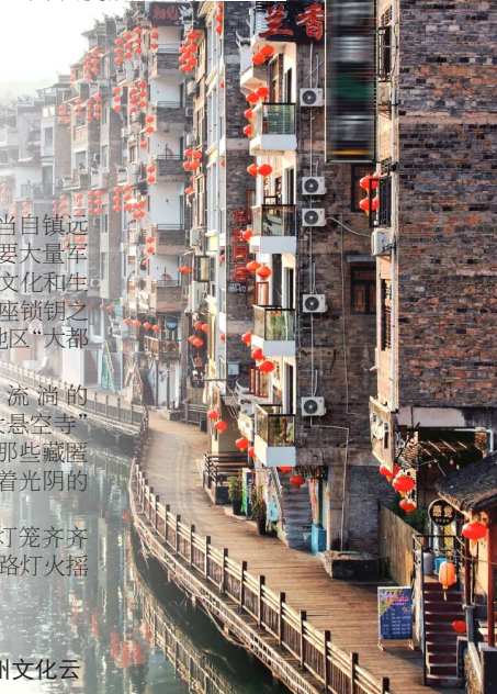
镇远古城 贵州·黔东南

近年来，飞云崖凭借其独特美学不断火爆出圈，阳光映照下，金黄的古银杏随风飘动，牌坊古朴精美，无论从哪个角度拍，都是氛围大片。