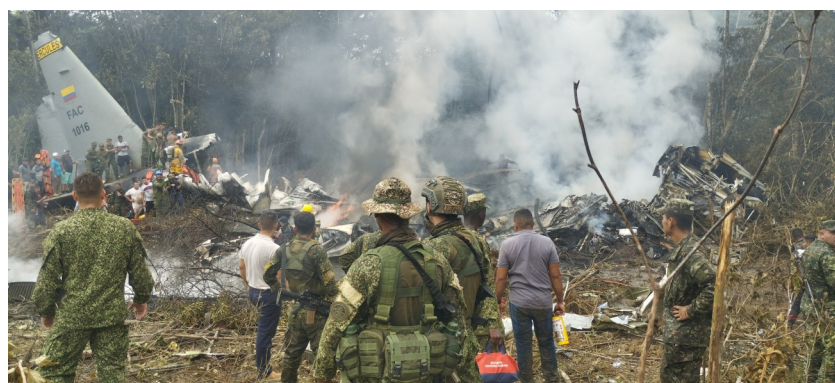
哥伦比亚军方23日告诉当地媒体,该国西南部普图马约省当天发生的军用运输机坠毁事件遇难人数已升至66人。

哥军方说,最新统计显示,机上共载有128人。除66人遇难外,还有57人受伤、4人失踪、1人未受伤。