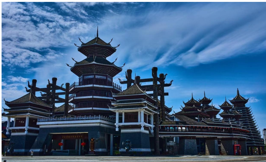
多彩贵州城(资料图片)

省88个县(市、区)的140余道特色小吃;“海市山盟”餐饮综合体以海鲜与贵州山珍