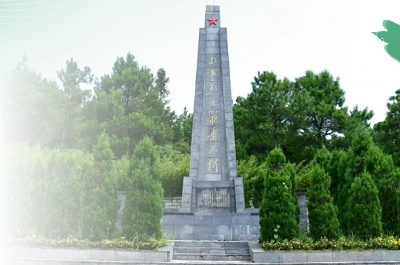
百宜红军烈士陵园

又是一年清明时 缅怀逝者 祭扫追思 清明这个特别的日子 总能忆起一群特别的人 他们为国为家为民族 舍生忘死，昭于日月，垂于青史 今天，小编带大家走进贵阳的烈士陵园 一起缅怀先烈，致敬英雄！