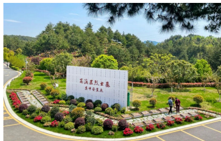
花溪区福泽园烈士集中安置点（缅怀园）