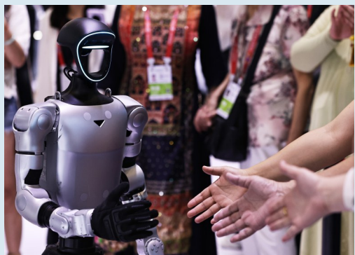
科技消费展区,观众与宇树机器人互动

本届消博会上,60多个国家和地区的超3400个品牌集结亮相,体现绿色、健康、数字、智能等新型消费的精品好物集中亮相。杭州程天科技发展有限公司带来新一代AI可穿戴外骨骼,搭载动力系统与AI算法,可根据个人数据智能调节助力强度。杭州群核信息技术有限公司展示的家装AI机器人设计师“小酷”,仅仅数秒就能生成一套可以查看细节的三维设计图。