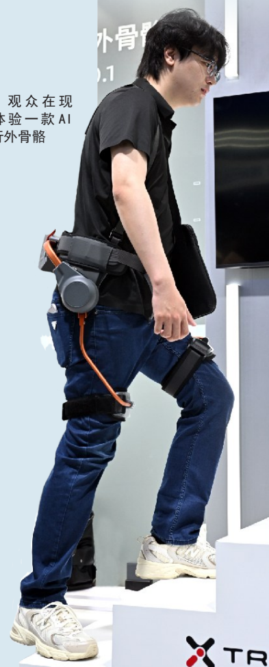
观众在现场体验一款AI助行外骨骼