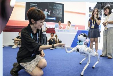
观众跟机器狗握手