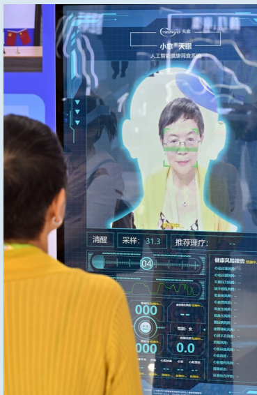
参观者体验人工智能健康筛查系统