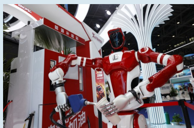
中国石化展台展示机器人加油