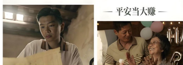
— 平安当大赚 —