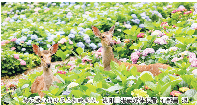
梅花鹿与绣球花丛相映成趣。