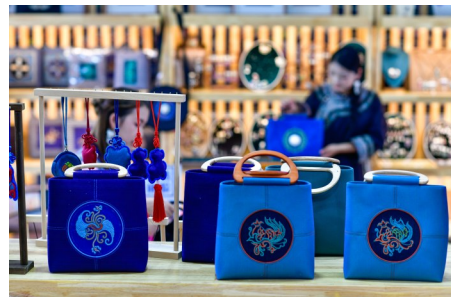
三都水族自治县水仙马尾绣展示馆里的手提包