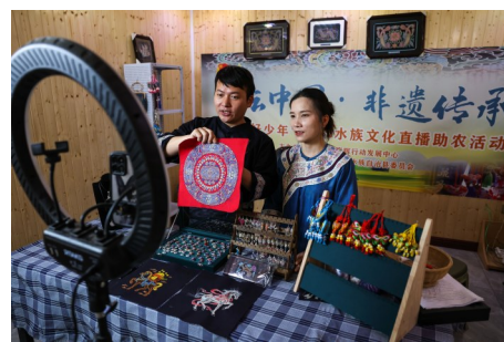
5月20日，在贵州省三都水族自治县水族马尾绣博物馆，工作人员直播推介马尾绣作品