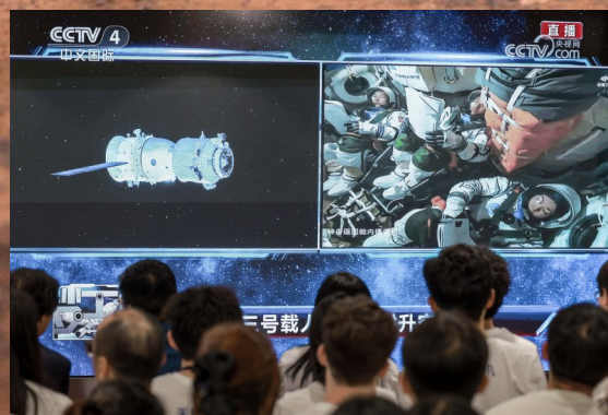
这是5月25日在北京航天飞行控制中心飞控大厅拍摄的交会对接实时画面